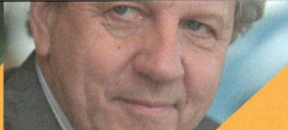
Kristien Hemmerechts