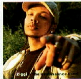
Ziggi The Renaissance Band