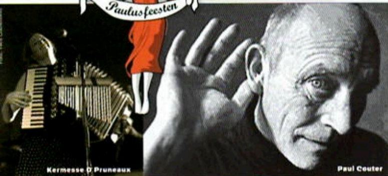
Kermesse O Pruneaux