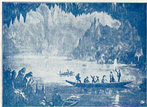
Le Lac d'Embarquement